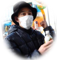
自動販売機でジュースを買いました