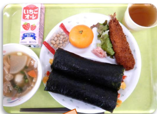
肉巻き寿司 イワシの梅しそ フライ けんちん汁 節分豆